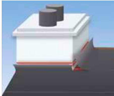
Verklebung von Dachbahnen im Schornstein-Anschlussbereich