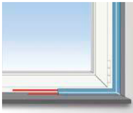
Verklebung von Fensterfugenbändern an Rahmenprofile und Fensterlaibungen